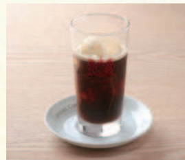
コーヒーフロート Coffee Float

表示価格には消費税が含まれております。(An excise is included in the display price.) 原材料(アレルギー表示)については係員にお尋ねください。