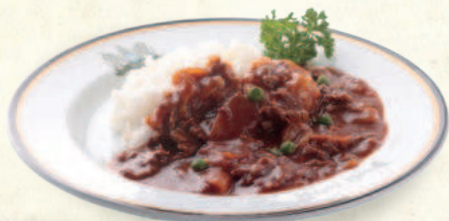
ハヤシライス Hashed Beef with Rice

Omelet with Ham Pilaf (Sauce Americaine)