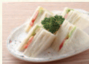
ヤサイサンド Vegetable Sandwich