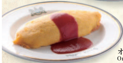
オムライス Omelet with Ham Pilaf