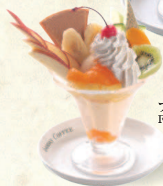
フルーツパフェ Fruit Parfait