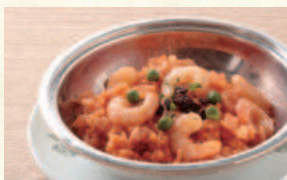
エビピラフ Shrimp Pilaf