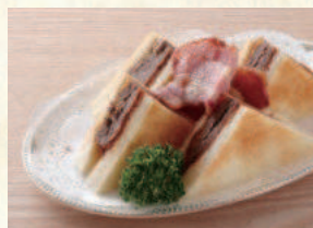
ビーフカツサンド Beef Cutlet Sandwich