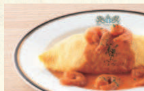
オムライス (エビクリームソース) Omelet with Ham Pilaf (Sauce Americaine)