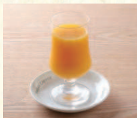
オレンジジュース Orange Juice