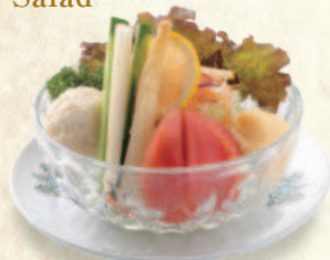
ヤサイミックスサラダ Vegetable Mixed Salad