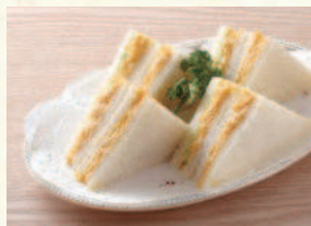
タマゴサンド Egg Sandwich