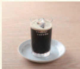
アイスコーヒー Iced Coffee