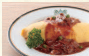
オムライス (ハヤシソース) Omelet with Ham Pilaf (Hashed Beef Sauce)