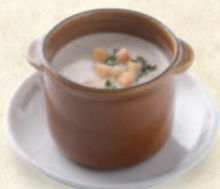
マッシュルームスープ Mushroom Soup