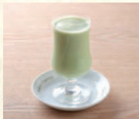
ミックスジュース Mixed Juice