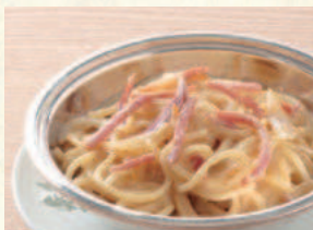
ボルセナ(ホワイトソース) Spaghetti Bolsena(White Sauce)

イタリアン(トマトソース) Spaghetti Italian (Tomato Sauce)