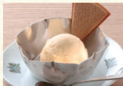
レモンアイス Lemon Ice Cream

表示価格には消費税が含まれております。(An excise is included in the display price.) 原材料(アレルギー表示)については係員にお尋ねください。