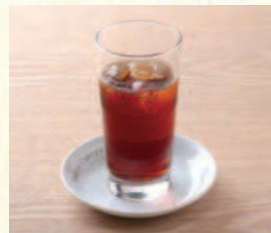
アイスストレートティー Iced Straight Tea