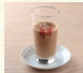
アイスカフェオーレ Iced Café au lait