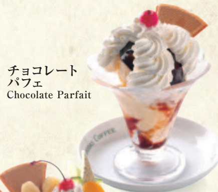
チョコレート パフェ Chocolate Parfait