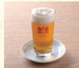
ビール(グラス 334ml) Glass Beer 334ml

表示価格には消費税が含まれております。(An excise is included in the display price.) 原材料(アレルギー表示)については係員にお尋ねください。