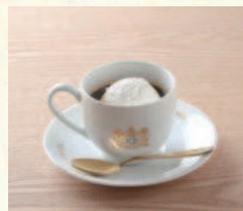
ウィンナーコーヒー Viennese Coffee