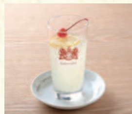
レモンスカッシュ Sparkling Fresh Lemonade