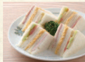
ミックスサンド Mixed Sandwich