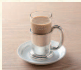
カフェオーレ Café au lait