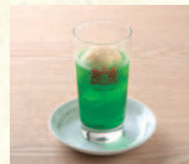
クリームソーダ Melon Soda Float