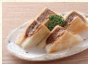
ハンバーグサンド Hamburg Sandwich