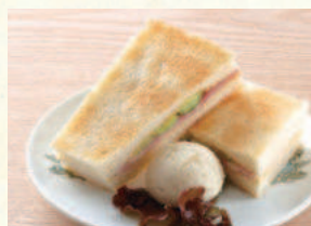
ハムトースト Hot Sandwich (Ham)