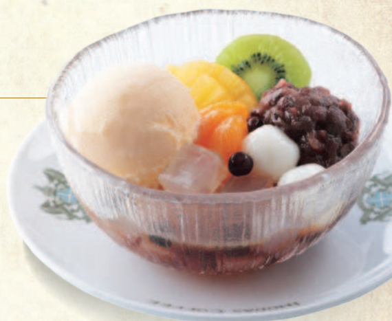
クリームあんみつ豆 Mitsumame topped with Ice Cream and Sweet Bean Paste