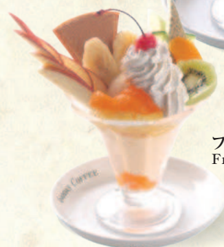
フルーツパフェ Fruit Parfait