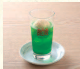
クリームソーダ Melon Soda Float